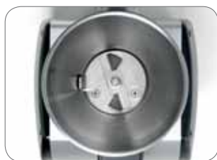
2. Coltelli Blades