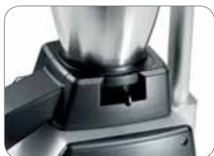
1. Leva per la regolazione dello spessore del ghiaccio Adjustable lever ice thickness